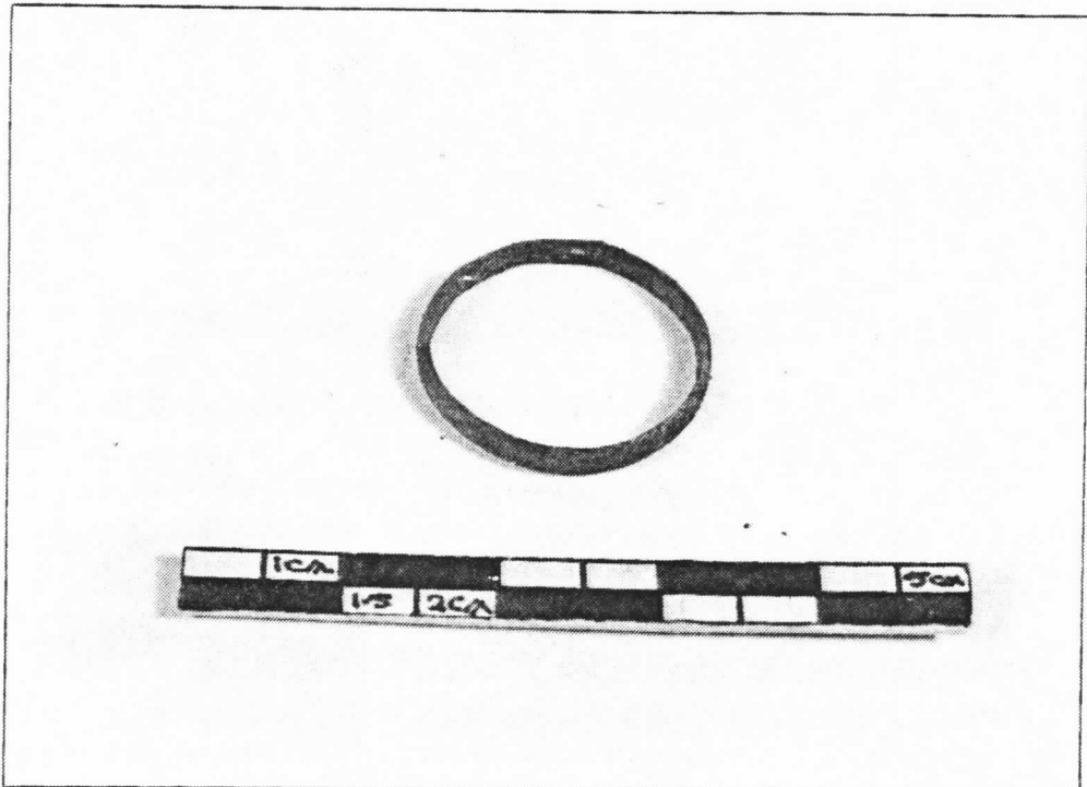
Figure 41: Perle de collier et jonc.